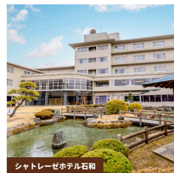
シャトレゼホテル石和

ラウンドされるお客様はもちろん、レストラン、スイーツビュッフェのみご利用のお客様にも心おきなくお楽しみいただけるよう、各駅より送迎のクラブバスをご用意。ご宿泊されるお客様には、「シャトレゼホテル旅館 富士野屋」「シャトレゼホテル 石和」とのご優待パックプランをご用意しております。