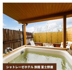
シャトレゼホテル 旅館 富士野屋

ラウンドされるお客様はもちろん、レストラン、スイーツビュッフェのみご利用のお客様にも心おきなくお楽しみいただけるよう、各駅より送迎のクラブバスをご用意。ご宿泊されるお客様には、「シャトレゼホテル旅館 富士野屋」「シャトレゼホテル 石和」とのご優待パックプランをご用意しております。